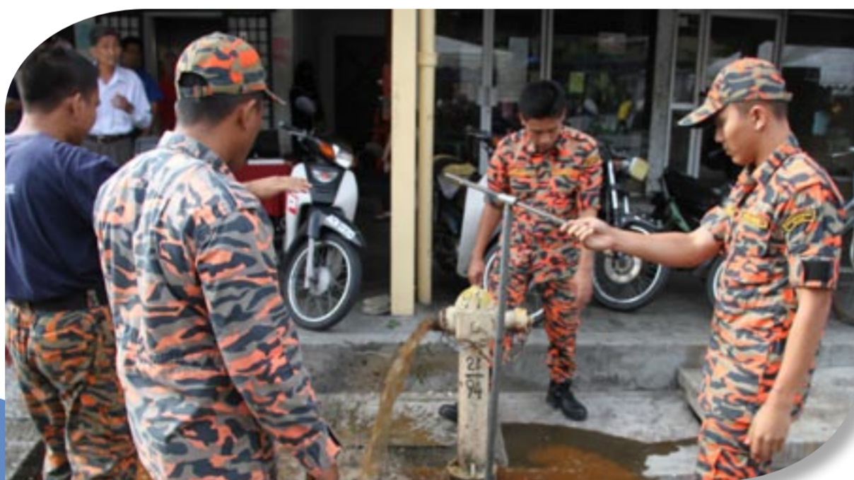
Jabatan Bomba dan Penyelamat Malaysia