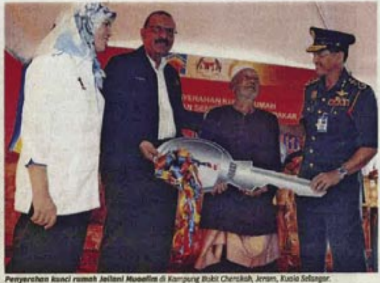
Penyertaan rasmi rumah kedai di Kemuning Bukit Kemuning, Jempin, Kuala Selangor.

Kejiri Nasional Blue Ocean Strategy (NBOS) adalah satu inisiatif kerajaan untuk meningkatkan kualiti perancangan projek kepada rakyat dengan pelbagai projek atau idea yang kreatif melalui kesepakatan antara pelbagai kementerian, jabatan dan agensi kerajaan, Negeri dan Pihak Berkuasa Tempatan serta pihak swasta. Kita berkesetiaan untuk melaksanakan projek-projek ini dengan berkesan dan mengikut jadual.