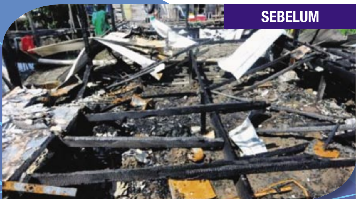
Kampung Kopunadan, Matunggong Kudat