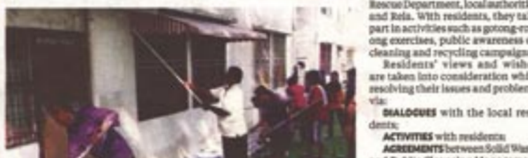
Residents of KP Taman Lokab, Seremban, Negri Sembilan, painting the outside of their houses in part of the MyBN programme.

FIFTY-THREE public housing schemes nationwide received a "facelift" when residents' associations and MyBN volunteers worked together with the authorities to transform the low-cost units and areas into great habitats.