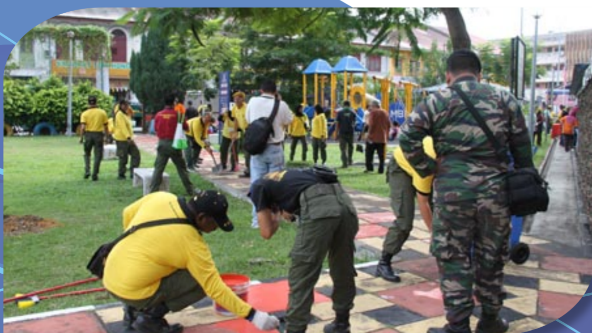
Angkatan Tentera Malaysia