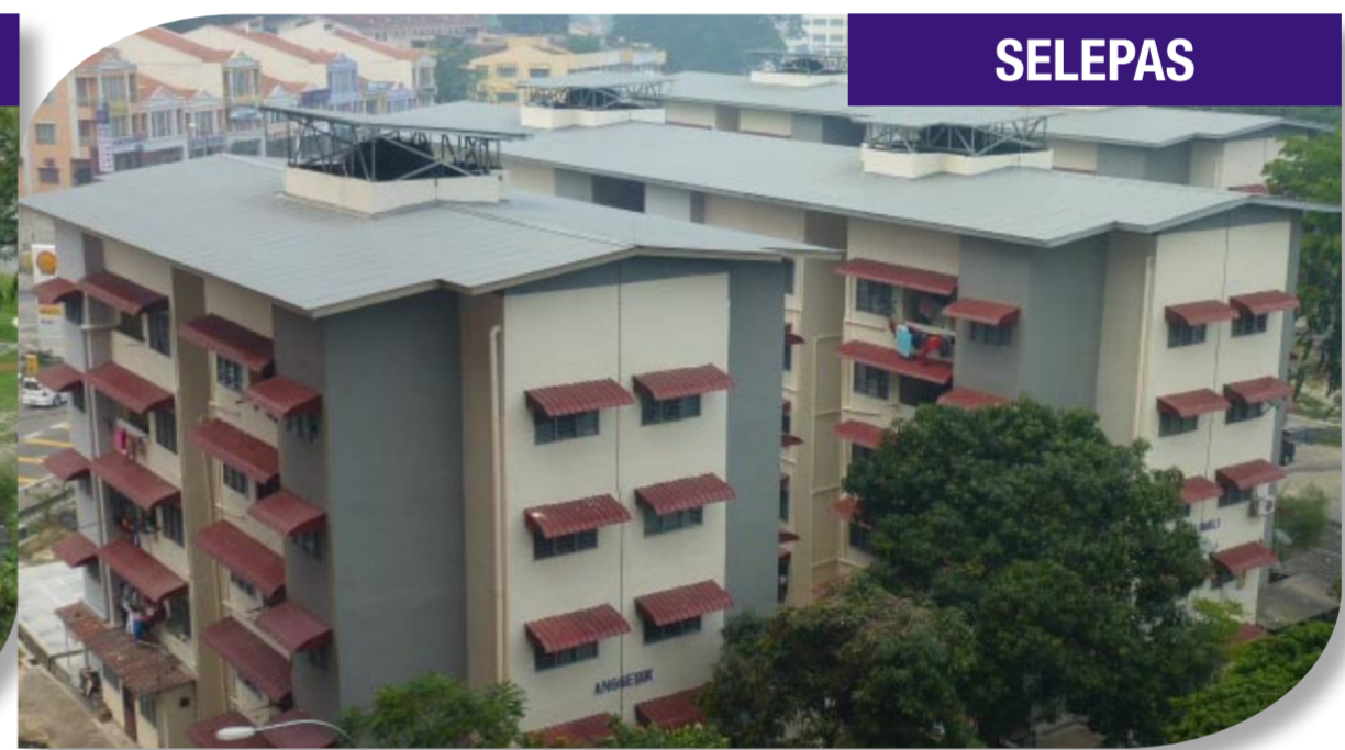
Cat semula bangunan, naik taraf bumbung dan pasang awning baru Rumah Pangsa Templer 2, Seremban