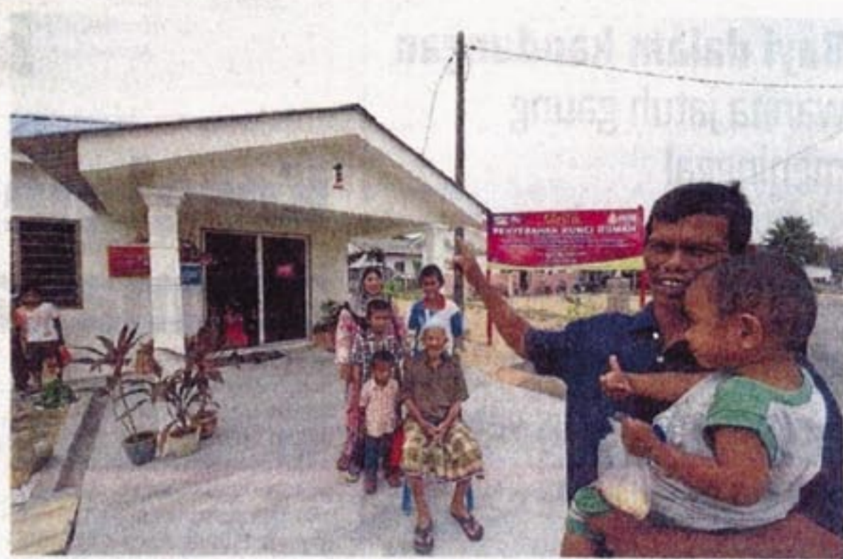
Pemilik rumah bergambar di hadapan rumah yang siap dibina dengan sistem Iris Koto di Kampung Taman Tasek, semalam.

Beliau berkata, kementerianya sedang meneliti sama ada konsep itu sesuai untuk menyediakan rumah pangsa PPR, terutama di bandar dan pinggir bandar.