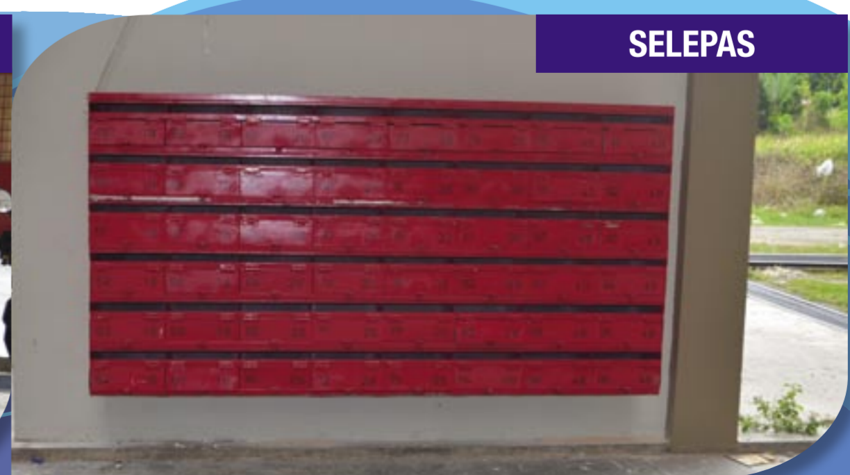
Naik taraf peti surat Rumah Pangsa Mengkarak Stesen, Bera