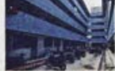
Program NBOS 7 yang telah dilaksanakan

30 Julai 2012: Lawatan tapak ke Flat Lokab, Seremban