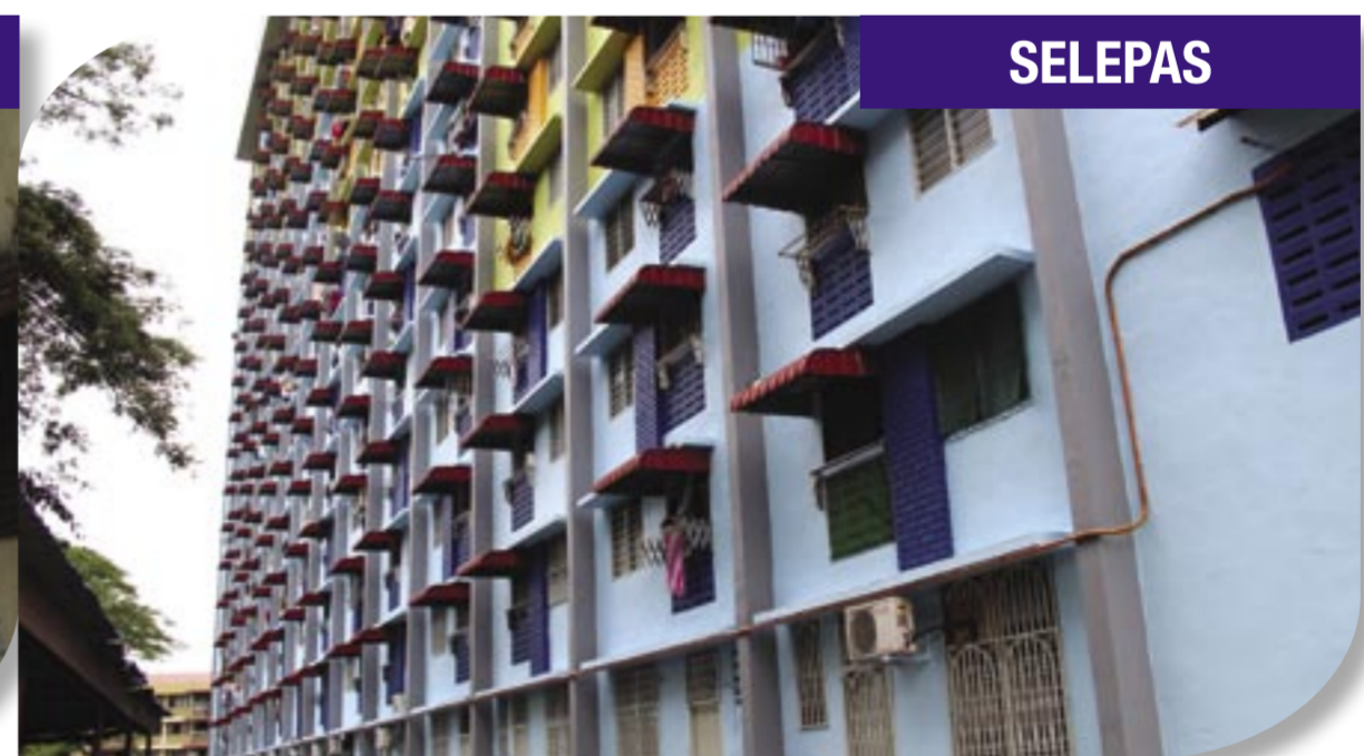
Cat semula dan pasang awning baru Rumah Pangsa Kinta Heights, Ipoh