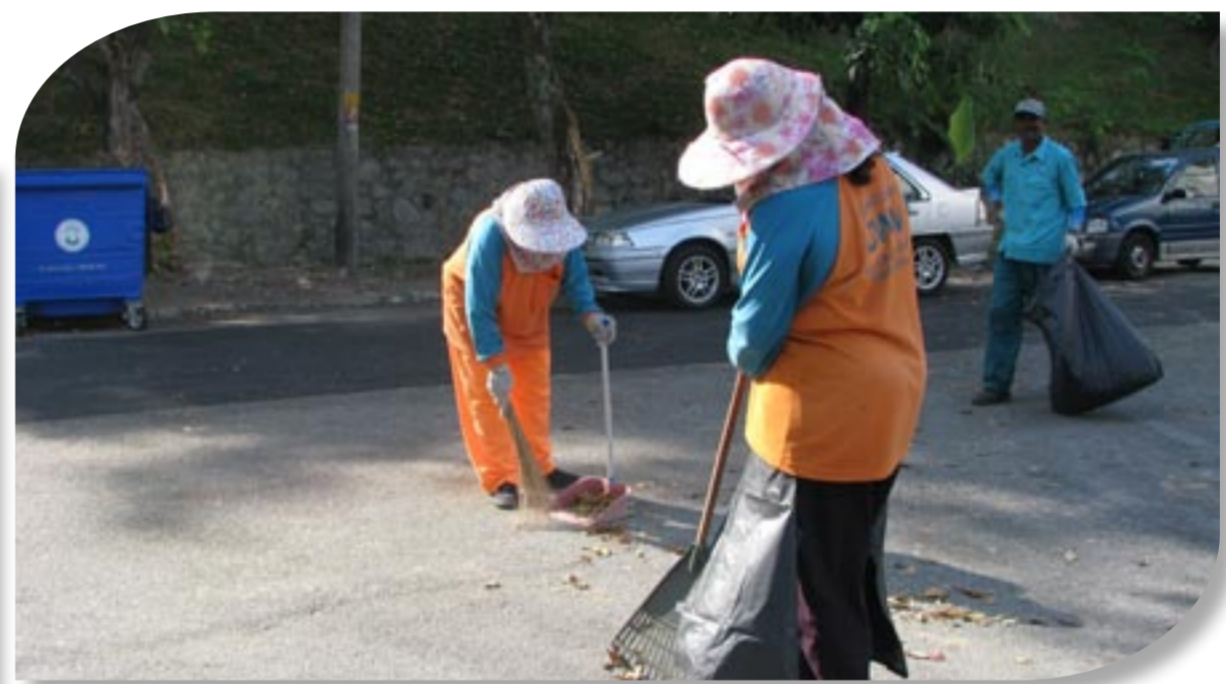
Perbadanan Pengurusan Sisa Pepejal dan Pembersihan Awam